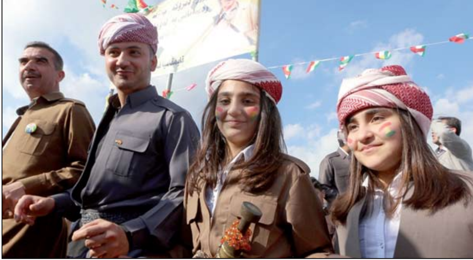
مواطنون من مدينة عقرة يؤدون الديكة الكردية احتفالاً بطلوع أعياد النوروز..