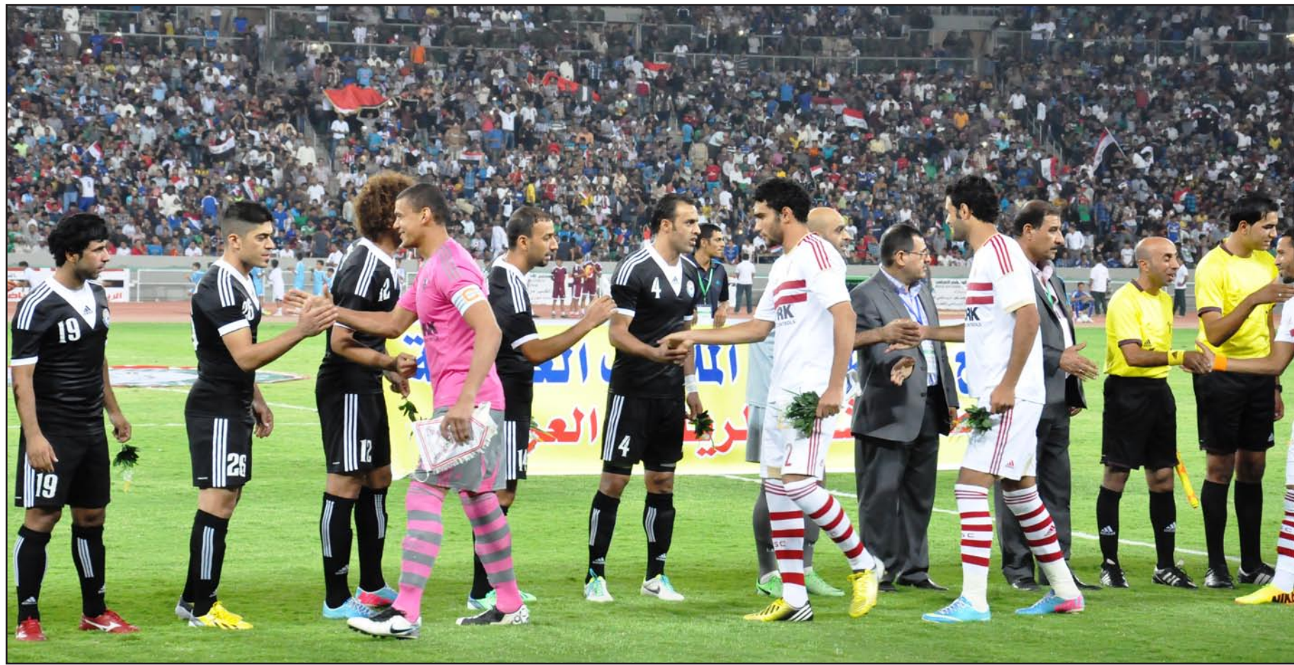
لاعبو الزمالك والزوراء قبيل المباراة الودية في افتتاح ملعب البصرة

الذي سيحتضن مباريات دولية ورسمية خلال الفترة المقبلة بعد أن يتم السماح من جديد للمنتخبات والأندية بخوض مبارياتها في العراق. ومن جهة أخرى وقع الاتحاد الدولي لكرة القدم (فيفا) غرامة مالية على مجلس إدارة نادي الزمالك المصري بقيمة ٢٠ ألف فرنك سويسري، وهو ما يعادل ١٥٨ ألف جنيه مصري تقريباً، بعد خوض الفريق الأول لكرة القدم في النادي لمباراة ودية أمام فريق الزوراء يوم ١٢ تشرين الأول الماضي بمناسبة افتتاح المدينة الرياضية في محافظة البصرة برغم استمرار الحظر على المنتخب والأندية العراقية بعدم خوض مباريات رسمية أو ودية على الملاعب العراقية بالعاصمة بغداد والمحافظات.