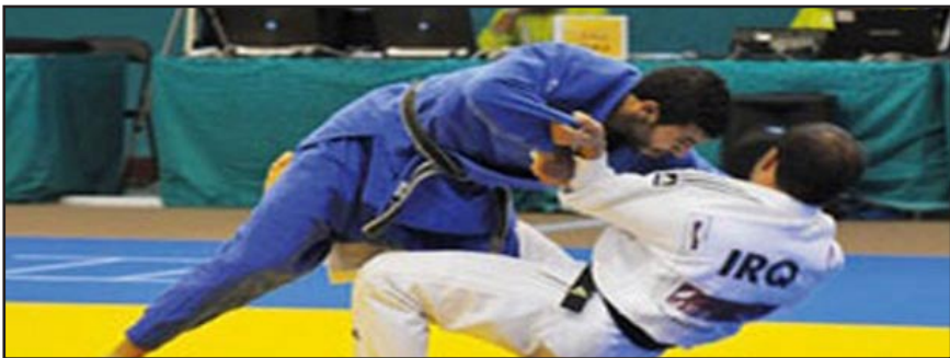
جانب من مشاركة المنتخب في بطولة العرب السابقة