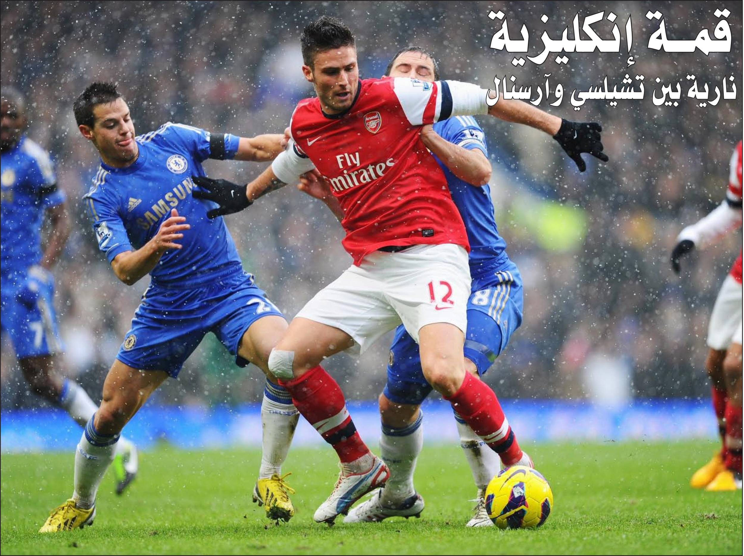
أرسنال يراهن على استعادة أماله في المنافسة بقاء تشيلسي

لغريه جوزيه مورينيو يبتلع كلماته في حلقه اليوم السبت حين يحل فريقه أرسنال ضيفا على غريمه تشيلسي في قمة لندنية ربما يُعيد الفوز بها للمنافسة في الدوري الإنكليزي الممتاز لكرة القدم. ولن يجد المدرب الفرنسي مناسبة للاحتفال بخوض مباراته الألف مع أرسنال أفضل من إنهاء السجل المثالي لمورينيو في ملعب فريقه