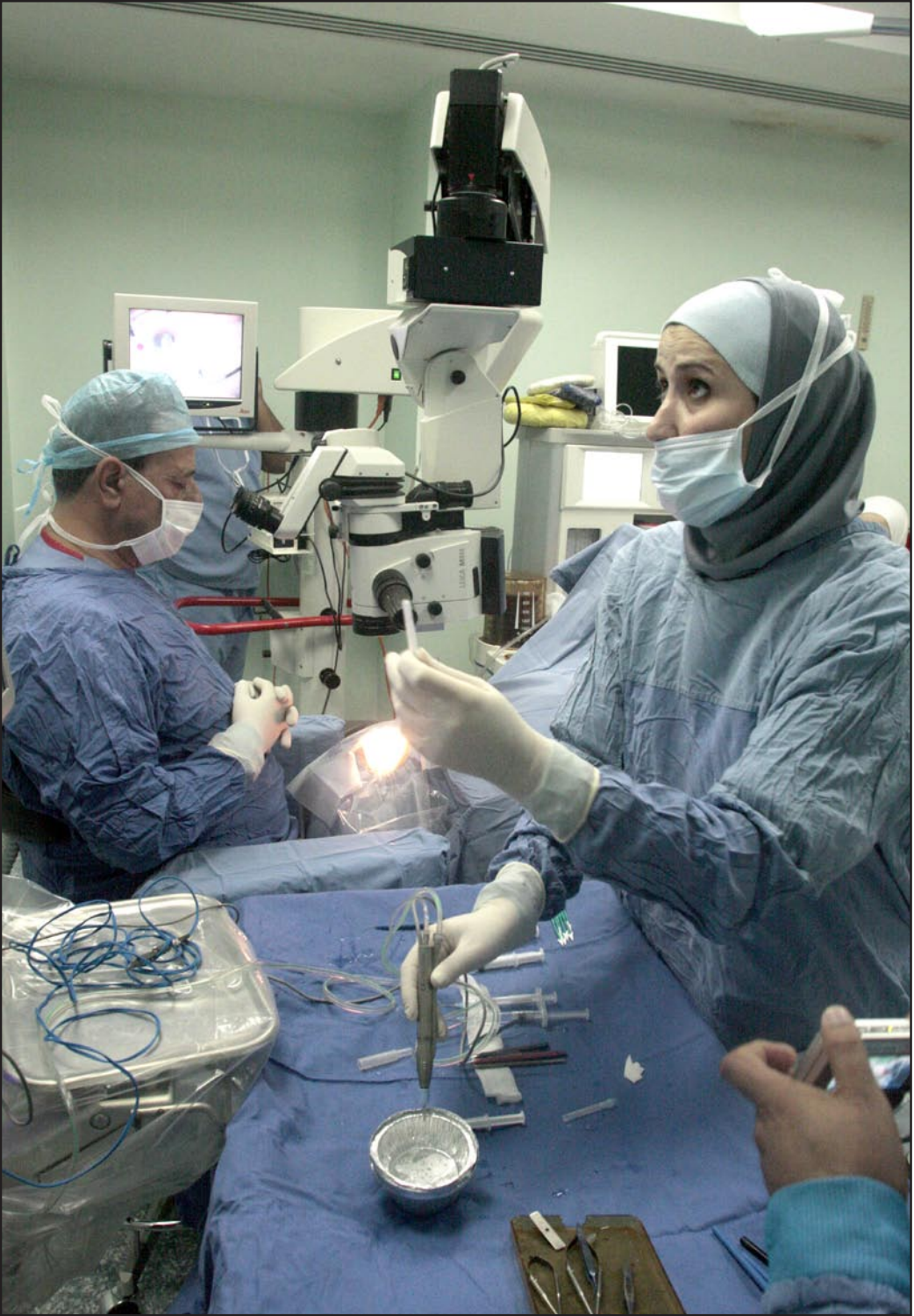
كادر طبي في تدخل جراحي

كادر طبي في تدخل جراحي كلية أخرى سليمة فلا بأس به، مع رضا وقناعة المتبرع كما يقول الشيخ، مشيراً إلى أن الأمر مرهون بشرط أن لا يكون المتبرع قاصراً ولم يصل سن البلوغ، أو به من سن الجنون وفي تلك الحالات لا يجوز ذلك مطلقاً، وإذا جاز القطع بالحالات المشروعة يجوز أخذ المال كمنفعة للجزء المقطوع بتراضي الطرفين.