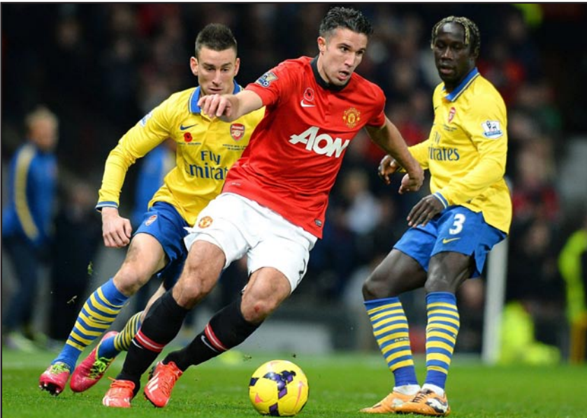
الشياطين الحمر في مواجهة نارية مع البايرن

ويتابع ريال مدريد حملة البحث عن لقبه العاشر (رقم قباسي) أمام بوروسيا دورتموند الألماني وصيف النسخة الأخيرة وبطل ١٩٩٧. فاز ريال ثلاث مرات على دورتموند أوروبياً وتعادلا ثلاث مرات وخسر مرتين. وللمرة الثانية على التوالي تتمثل ثلاثة أندية اسبانية في ربع النهائي، إضافة إلى فريقين من ألمانيا وكتلترا وآخر من فرنسا. وتقام مباراتا برشلونة - اتلتيكو ومانشستر يونايتد - بايرن ميونيخ في ١ و ٩ نيسان المقبل، وريال مدريد - دورتموند وتشيلسي - سان جيرمان في ٢ و ٨ منه، قبل قرعة نصف النهائي في ١١ منه. وتضيف العاصمة البرتغالية لشبونة المباراة النهائية في ٢٤ أيار.