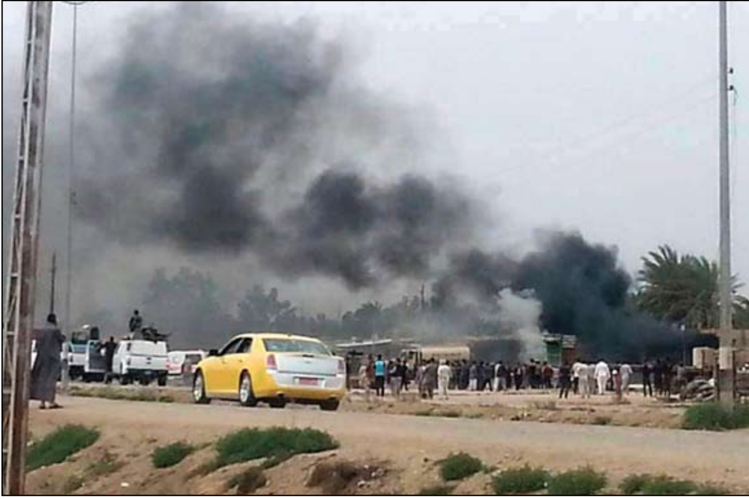
أحد التفجيرات في مناطق بغداد - أرشيف