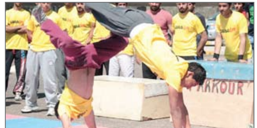
لاعبو باركور يمارسون تدريباتهم قرب بحيرة الجادرية في بغداد..