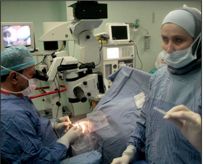
أثناء زرع الأعضاء البشرية

هذه الظاهرة والسبب الرئيس في انتشارها هي حالة العوز التي يعيشها بعض الأشخاص.