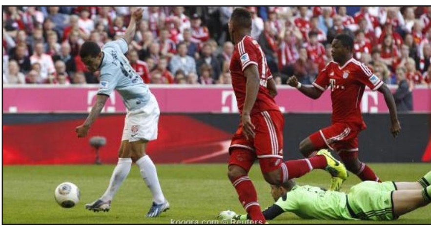
البايرن يأمل حسم اللقب مبكرا

ويدرك بايرن صعوبة المهمة التي تنتظره في مواجهة ماينز صاحب المركز الخامس في جدول المسابقة برغم خسارته ١-٤ أمام بايرن في الدور الأول. ويخوض بايرن المباراة ويتنظر التتويج العملي أو الرسمي وسط أجواء متباينة عاشها النادي البافاري في الأيام الماضية حيث تعرض رئيسه السابق أولي هونيس لعقوبة السجن ثلاثة أعوام ونصف العام بينما وصل الفريق انطلاقته في كل من (البوندسليغا) ودوري أبطال أوروبا.